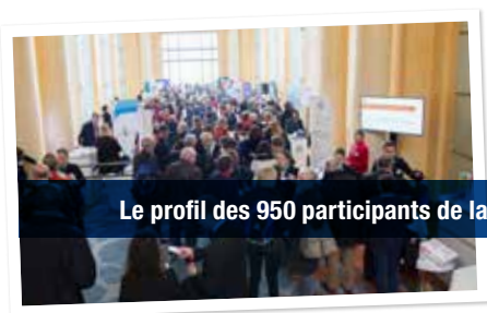
Le profil des 950 participants de la 15 ÈME UHFP